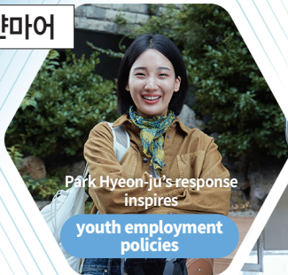
Park Hyeon-ju's response inspires youth employment policies