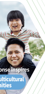
Dae Han's response inspires support for multicultural communities