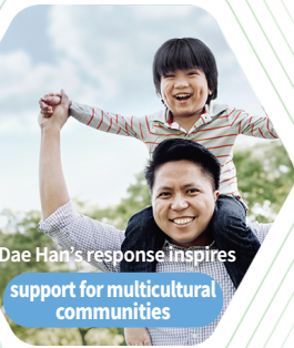
Dae Han's response inspires support for multicultural communities